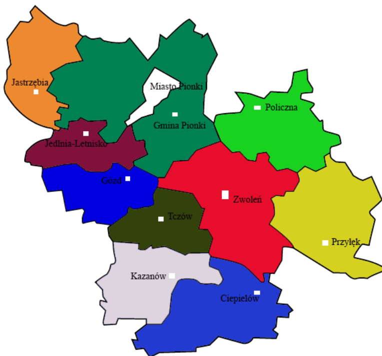
Tabela nr 3. Gminy należące do Stowarzyszenia „Dziedzictwo i Rozwój”

Powierzchnia tego obszaru wynosi 1 190,00 km 2 (118 949 ha), co stanowi 3,34% całkowitej powierzchni województwa mazowieckiego. W porównaniu do poprzedniego okresu obszar nie uległ zmianie, ale wszelkie dane począwszy od liczby ludności poprzez gęstość zaludnienia aż do salda migracji zostały zaktualizowane. Aktualnie na obszarze działania LGD „Dziedzictwo i Rozwój” mieszka 96 768 osób.